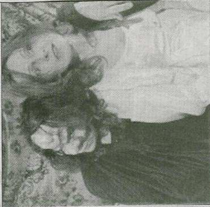
Musique, chant, Comedia dell'arte... Toutes les armes des femmes du théâtre du Petit Matin se déploient dans " Petite, te laisse pas faire ."